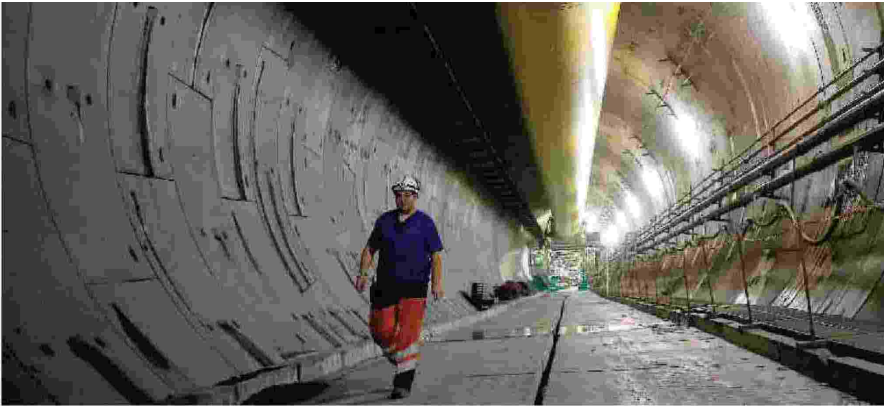
Un ingegnere cammina dentro al tratto francese del tunnel già scavato a Saint-Martin-La-Porte

Un estratto del rapporto di circa centoventi pagine a cui La Stampa ha avuto accesso. Sarà presentato a Bruxelles nei prossimi giorni.