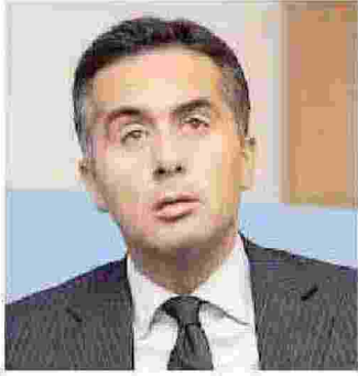
MASSIMILIANO SALINI EURODEPUTATO DI FORZA ITALIA