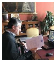
Il presidente Roberto Ciambetti

«Il Consiglio regionale del Veneto si riunirà martedì 31 marzo nel pomeriggio in seduta telematica: l'assemblea legislativa è a pieno regime». L'annuncio è arrivato dal presidente Roberto Ciambetti, al termine di una serie di riunioni in video conferenza che l'hanno visto impegnato da palazzo Ferro Fini. Prima di tutto con la Conferenza dei presidenti dei Consigli regionali «che ha individuato gli orientamenti sul possibile svolgimento dell'attività istituzionale in modalità telematica in casi di emergenza - spiega Ciambetti - con l'individuazione delle attività indif-