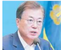
Il presidente sudcoreano Moon Jae-in, 67 anni

Il presidente brasiliano, Jair Bolsonaro, ha licenziato il ministro della Salute, Luiz Mandetta. Su come affrontare il virus, i due erano su posizioni opposte: Mandetta ha difeso l'isolamento, mentre il presidente è preoccupato a far ripartire l'economia. A dare l'annuncio lo stesso Mandetta su Twitter.