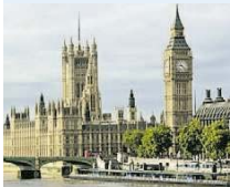
Il Parlamento britannico

Niente parata militare sulla Piazza Rossa, a Mosca, il 9 maggio, per celebrare i 75 anni dalla vittoria della Seconda guerra mondiale. Il presidente Vladimir Putin ha annunciato ieri che il grande evento, a causa dei rischi legati alla pandemia di coronavirus, sarà posticipato.