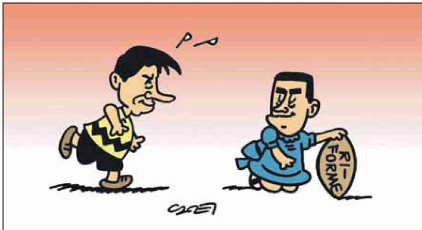
Vignetta di Claudio Cadei

Questo Parlamento è stato eletto sulla base di circoscrizioni che ne rispecchiavano la vecchia composizione. Se vincessero i Sì bisognerebbe rivederle tutte, e questo potrebbe essere un alibi per evitare lo scioglimento delle camere. Ma le nuove circoscrizioni, e la nuova legge elettorale, sarebbero decise da questo Parlamento che sarebbe incompatibile con la nuova Costituzione. Insomma un gatto che si morde la coda