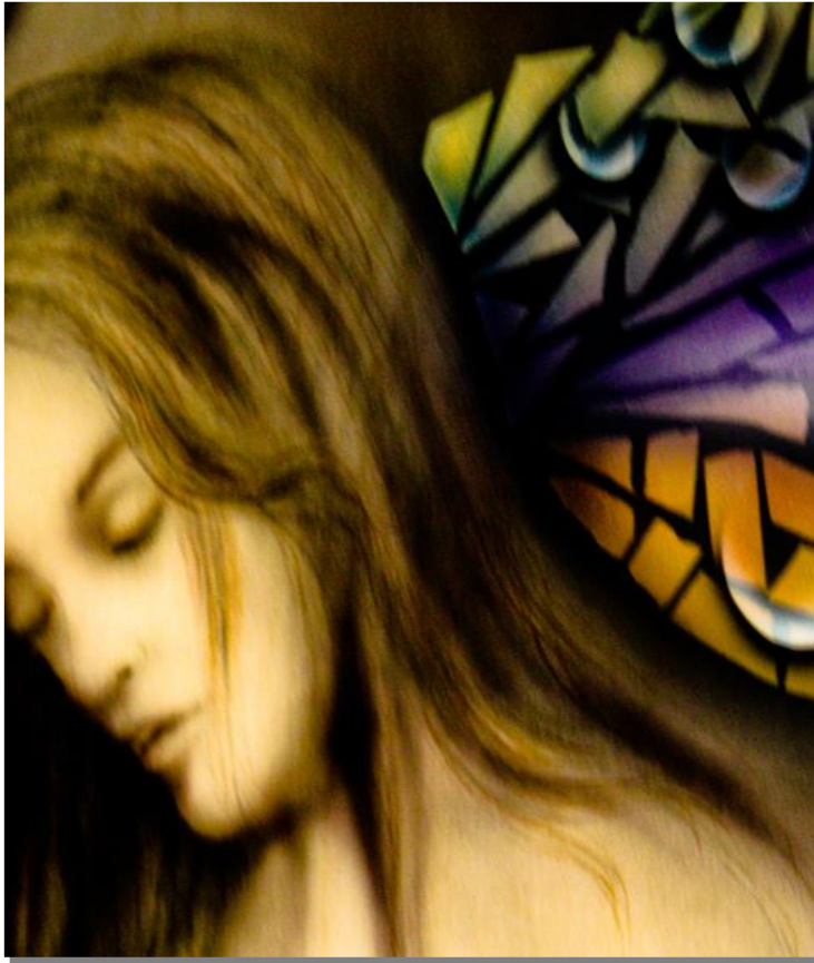
Crisalide-Adriano Marangoni - olio su legno