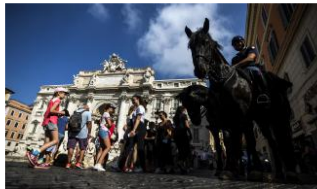
Ferragosto Polizia a cavallo in servizio tra i turisti a Fontana di Trevi

In Lombardia, regione che in accordo con la struttura commissariale ha scelto di proseguire con prenotazione obbligatoria per tutte le fasce, sono poco meno di 495.000, pari al 65% del totale, gli adolescenti che hanno aderito alla campagna vaccinale. Di questi, 379.699 (circa il 50%) hanno ricevuto almeno la prima dose, mentre sono 234.208 i giovani (30%) che hanno già completato il ciclo vaccinale. In Friuli Venezia Giulia per la fascia "teen" è stata predisposta una corsia preferenziale con orari ad hoc.