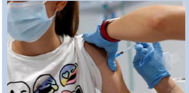
Teenager Al via le dosi vaccinali per i più giovani ANSA

Con il Ferragosto alle spalle, la campagna di vaccinazione tenta l'accelerazione in vista delle riaperture di settembre, in primis l'avvio dell'anno scolastico. Determinante ad imprimere nuovo impulso alle somministrazioni, dopo il fisiologico rallentamento dell'ultimo weekend, potrebbe rivelarsi la possibilità, entrata in vigore ieri, per tutti i teenager di accedere al vaccino senza prenotazioni. I ragazzi tra i 12 e i 18 anni potranno vaccinarsi con Pfizer e Moderna. Nei giorni scorsi il Commissario per l'emergenza Francesco Figliuolo ha scritto alle Regioni una lettera chiedendo per loro una «corsia preferenziale» in vista della ripresa della scuola a settembre, con l'obiettivo di immunizzare quel milione e 600mila ragazzi che non hanno fatto neanche una dose. Il via libera per gli under 18 coincide anche con l'arrivo,