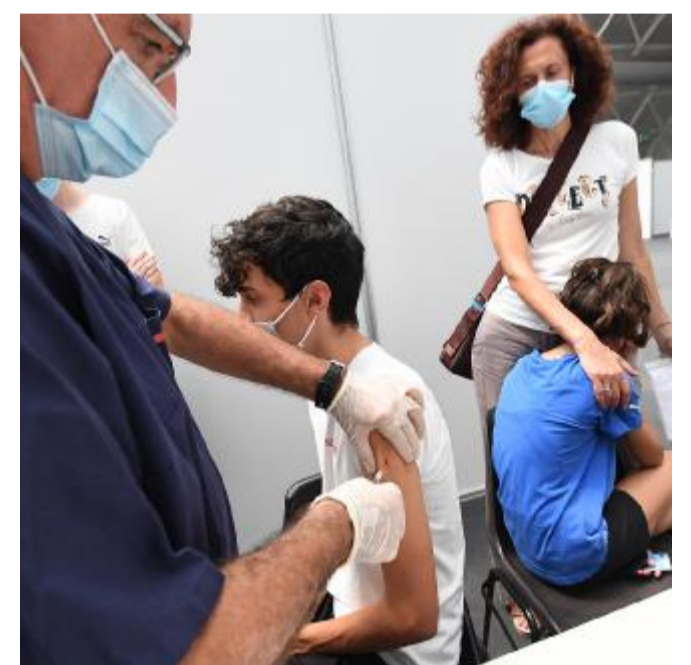
Le somministrazioni Vaccini ai giovani e adolescenti

Concessionaria pubblicità PubliAdige S.r.l. Verona - Corso Porta Nuova, 67 - Tel. 045.9600.200 Sportello ferie: 9-13/15-19; festivo 15-19.30 solo necrologie: Tel. 045.9600.200 Fax 045.9600.211 Pubblicità nazionale: A. Manzoni & C. S.p.A. Via Nervesa, 21 - 20139 Milano - Tel. 02.57494802 www.manzoniadvertising.it