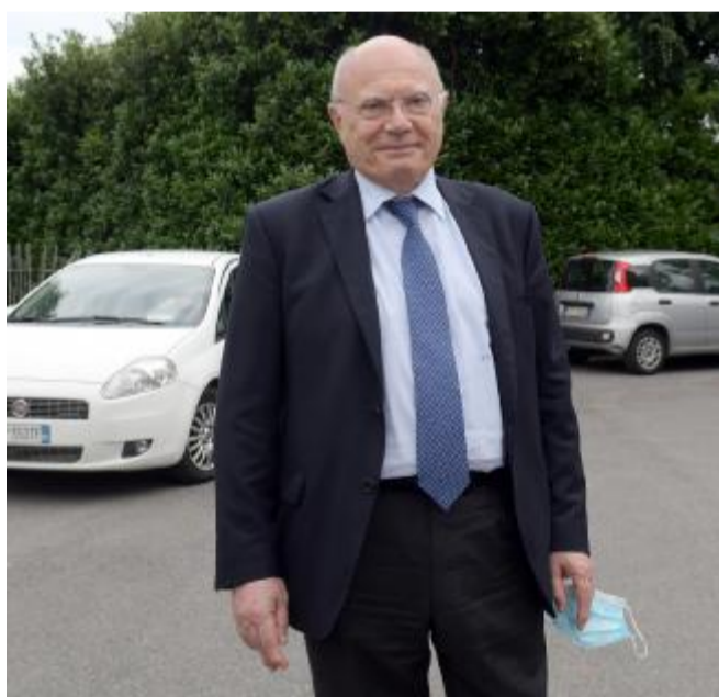
Il parere Il professor Massimo Galli

razioni degli scienziati anche in Italia, che ritengono la stima dei casi al di sotto dei numeri reali, essendo buona parte degli infettati senza sintomi e quindi non sottoposti al test. «Per leggere correttamente la curva dei contagi adesso», dice l'infettivologo Massimo Galli, primario dell'Ospedale Sacco di Milano, «bisogna soprattutto chiedersi quanto siano attendibili i dati a disposizione in questo particolare periodo dell'anno, agosto e gente in ferie fuori dalla propria sede. È altamente probabile che il numero dei contagi sia molto più alto rispetto a quello ufficiale». Sulla stessa linea è Roberto Cauda, direttore della Clinica di malattie infettive del Policlinico Gemelli di Roma, che spiega: «Quello che vediamo oggi non corrisponde alla totalità dei casi di Coronavirus perché negli ultimi giorni è stato fatto da un