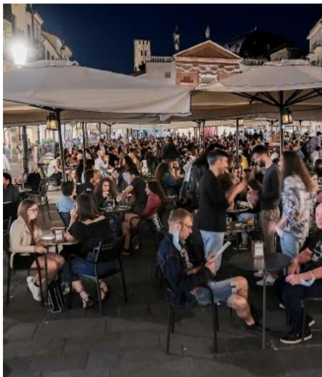
Il rischio Aumentano gli assembramenti nei bar e ristoranti

Si avvicinano al rischio anche la Calabria (14% in area non critica, ma per fortuna al 7% per la rianimazione) e la Sardegna, rispettivamente a