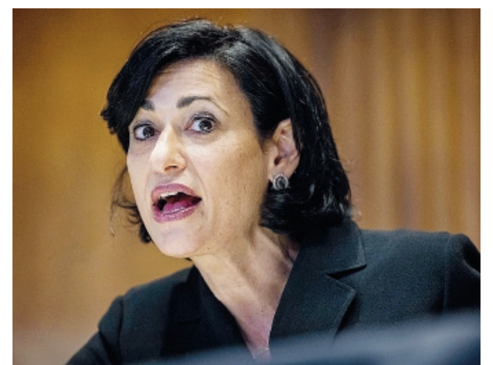
CAPO La direttrice del Cdc americano, Rochelle Walensky

Se anche chi ha il green pass con doppia vaccinazione può contribuire, in piccola parte, alla trasmissione del virus, non c'è da stare tranquilli con chi lo ottiene dopo la prima dose. Della questione si sta discutendo in Germania. Per il presidente dell'Istituto Robert Koch, l'Istituto superiore di sa-