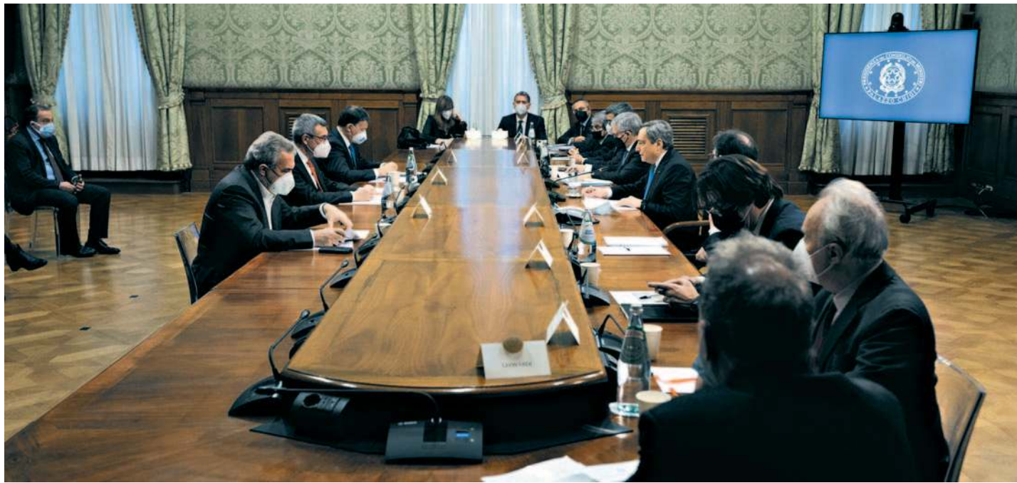
US CHIGI/ FILIPPO ATTILI/ANSA

Buone notizie anche sul fronte delle tasse. Il governo ha deciso di tagliare l'Irpef, modificando aliquote, scaglioni e detrazioni. Ne beneficiano, da marzo con conguaglio,